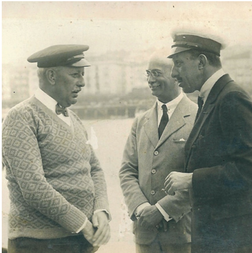
Horacio y Alfonso XIII

Creó un enorme emporio económico, cultural y social.