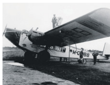
Iberia, primer avión Rohrbach Roland

A pesar de sus buenas relaciones con las monarquías europeas, siempre fue republicano convencido y militante, y rechazó el título de marqués que le ofreció Alfonso XIII por el rescate de los presos de la Guerra de África, que llevó a cabo in situ, comprometiendo su vida y bienes.