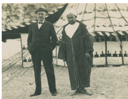
Junto a Abd El Krim